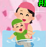
ベビースイミング

「子どもに水慣れをさせたい」 「夏に子どもとプールで遊びたい」 そうお考えの 保護者の皆様 ！